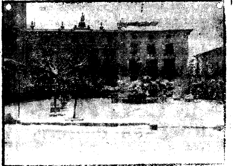
LORCA.—En la famosa «Ciudad de Sol» también sufrieron los embates del intenso temporal de nieve que azotó estos días a nuestra provincia. He aquí el aspecto que ofrecía ayer una de las más céntricas plazas de la bella ciudad.