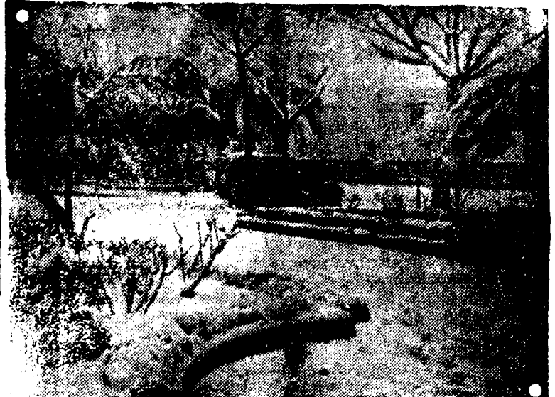
Ayer mañana, los jardines y arbolado que circundan las afueras de nuestra ciudad, ofrecían un bello aspecto, recubiertos por la immaculada blancura de la nieve, admirándose bellos paisajes como el que nos muestra esta fotografía.